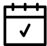
Tavola rotonda Protesica d'anca